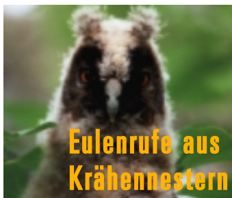
Eulenklaue aus Krähennestern