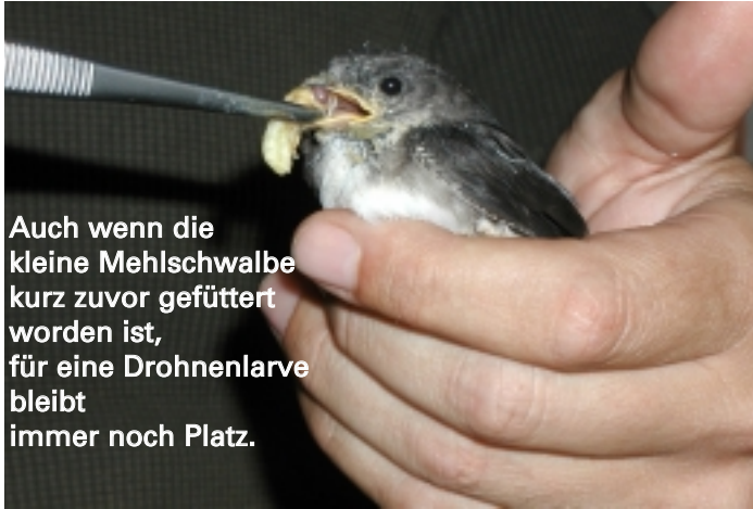
Auch wenn die kleine Mehlschwalbe kurz zuvor gefüttert worden ist, für eine Drohnenlarve bleibt immer noch Platz.